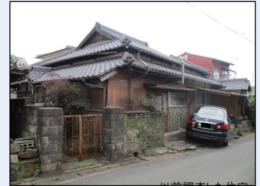
以前調査した住宅